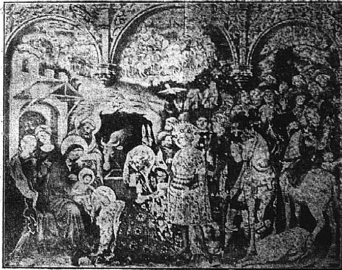
OS REIS MAGOS ADORANDO A JESUS