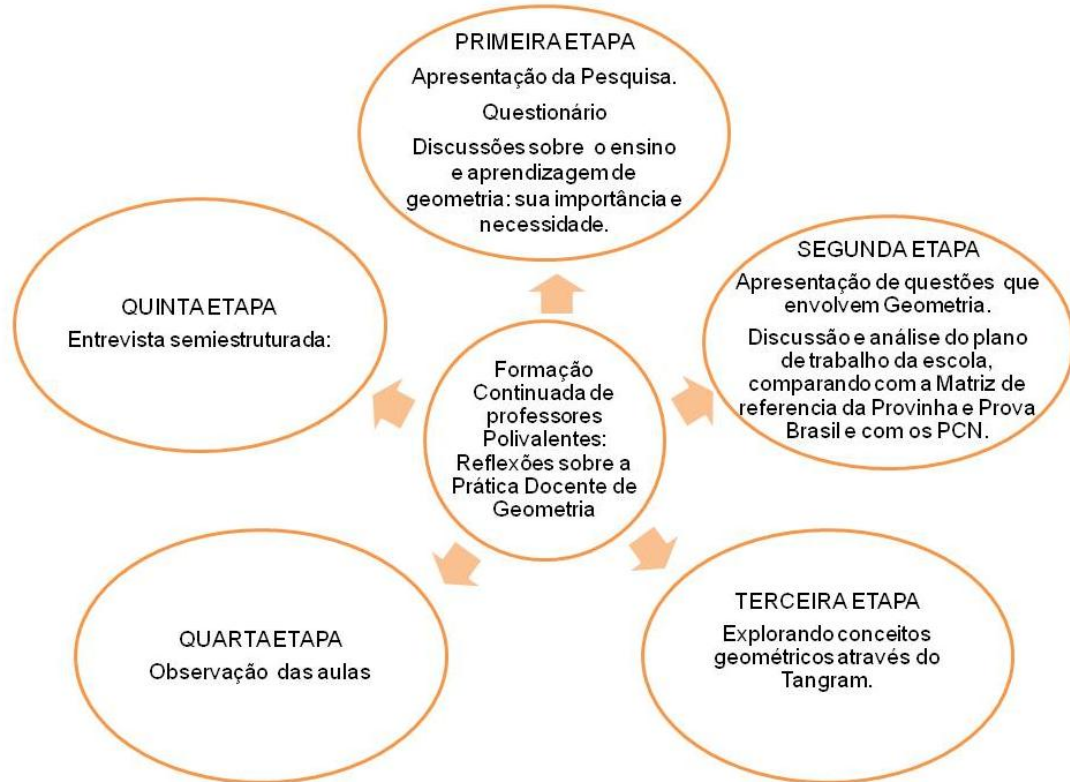
Figura 1- Esquema da pesquisa